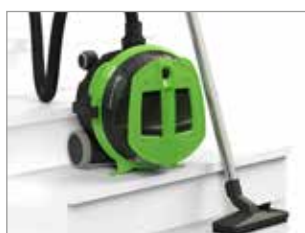
POSICIÓN DE ESTACIONAMIENTO EN ESCALERA