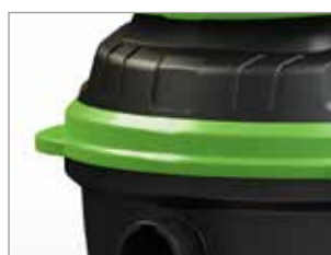
PROTECCIÓN LATERAL PARA PUERTAS Y PAREDES