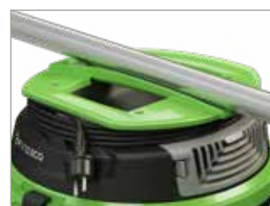
ASA ERGONÓMICA CON PORTACABLE INTEGRADO